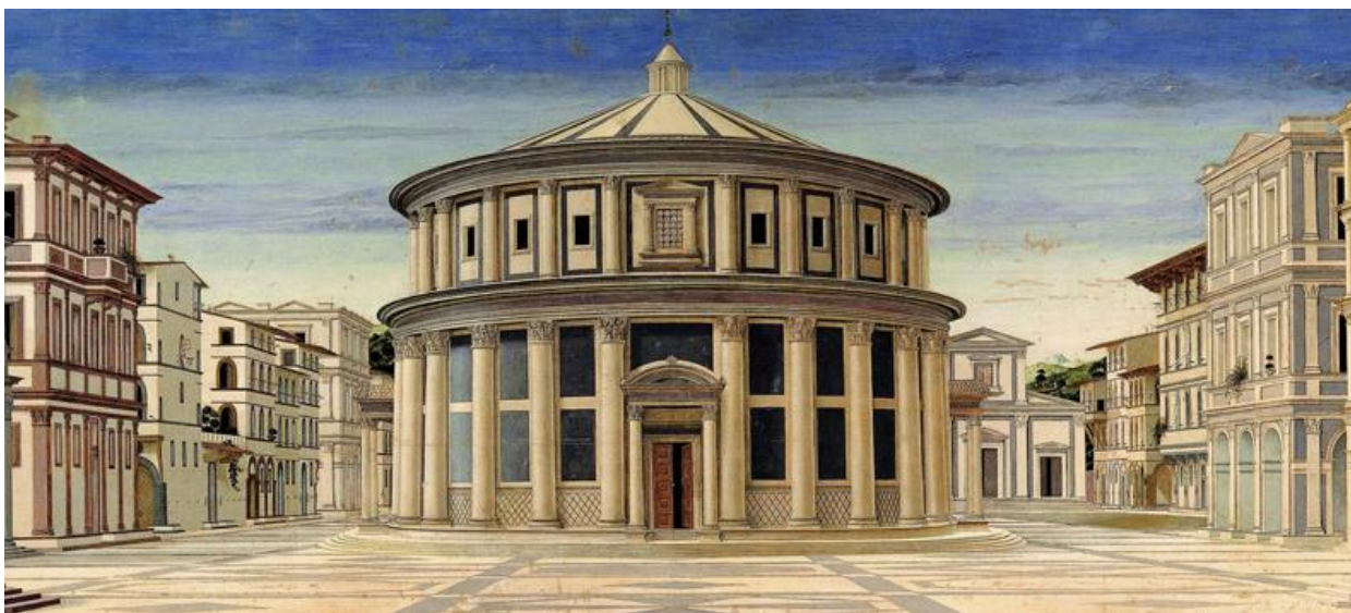
„The Ideal City“, priskiriamas Fra Carnevale, XV a.