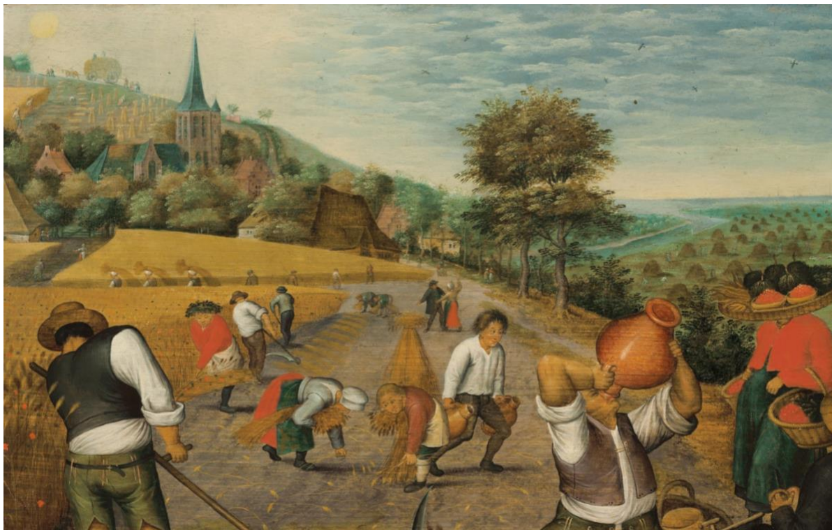
Pieter Brueghel the Younger, „Summer Harvest“, The Nelson-Atkins Museum of Art, 1615–1625.